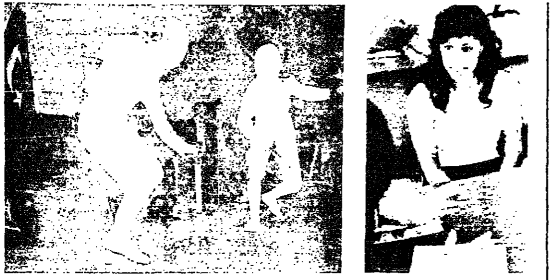
مباراة الطويل في فقه من اللقاء الدولي

طلب من غنور رئيس لجنة الشرق المارة ونادي المجه كره الكثره عن كتاب وجهه الى اللجنة لتأجيل لاجداد الكرة ، داخل اصحاب الهيئة الادارية الجديدة للجنة للشرق الممتازة المرحه يوم ١٩ آب الحالي لان مدة التجهه الحالية لم تنته بعد .